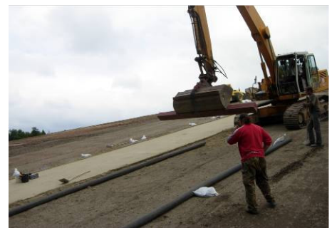
Verteilen von Trisoplast