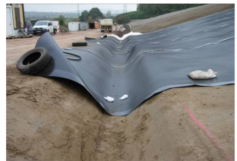
Problemloses Ausformen eines Grabens